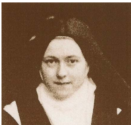
Autentická fotografie sv. Terezie od Dítěte Ježíše