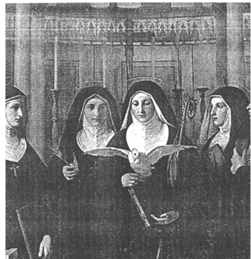
Scholastika. Podle malby v beuronském klášterním kostele

Jisté je, že v posledních letech svého života žila Scholastika jako mniška v blízkosti velkého kláštera Montecassino, kde působil její bratr. Jednou za rok jej navštěvovala. Setkávali se v malém domku, který byl u vchodu do montecassinského opatství. Benedikta při tomto setkání vždy doprovázel jeden z bratří mnichů. Protože se oba dva sourozenci ve svém životě starali