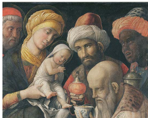
Klanění mudrců: A. Mantegna 1495