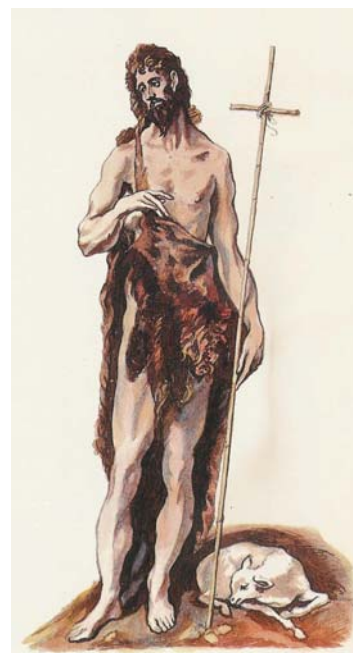
Svatý Jan Křtítel podle El Greca (1605)

Pokoj nastává tam, kde jsou uspořádané vztahy. Platí to především o rodině, farním nebo řeholním společenství, v nejrůznějších seskupení lidí. Někdy se však stává, že velcí aktivisté, kteří na veřejnosti horlí pro mír ve světě mezi státy, selhávají ve vztahu k nejbližším. Dá se také říci, že ten úplně nejbližším je nám Pán Ježíš. Základem pravého pokoje je nezanedbaný vztah k němu. V něm má dokonalé zalíbení nebeský Otec, jak je také výslovně řečeno v evangeliu, které zaznívá na poslední den vánoční doby, na svátek Křtu Páně, kdy je v tělesné podobě holubice manifestována i přítomnost Ducha svatého, a tak se zjevuje jediný Bůh ve všech třech osobách. Boží Syn přišel mezi nás, aby do našich srdcí a vztahu vnášel pokoj pulzující v nejharmoničtějším vztazích tří božských osob. I když nejsme zdaleka schopni přijmout tento pokoj v jeho plné síle a bohatosti, zachycujeme alespoň jeho paprsky.