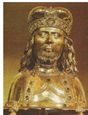
Stříbrná schránka na relikvie svatého Václava z 15. století v dómském pokladu sv. Víta v Praze