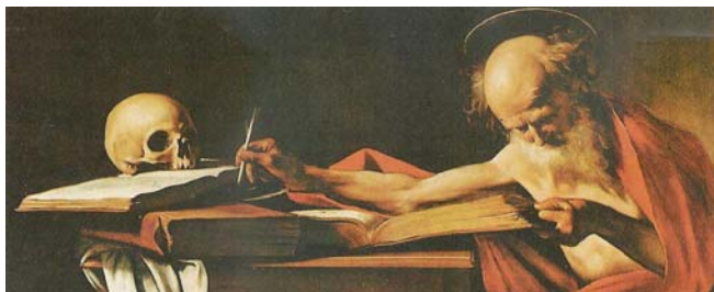
Obrázek "Jeroným v jeskyni" od Caravaggia