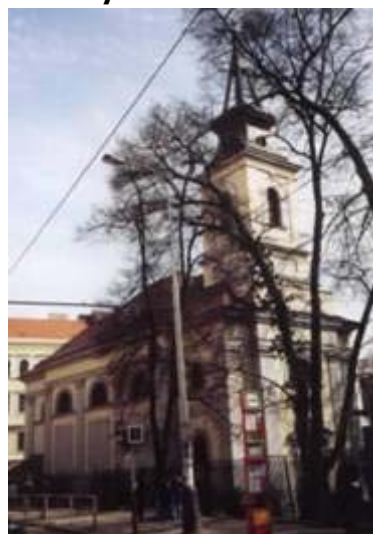
Kostel Největější Trojice: empírová stavba s věží, zbudovaná v letech 1831 - 1837 na místě starší barokní kaple. Kostel stojí na Malostranském hřbitově.