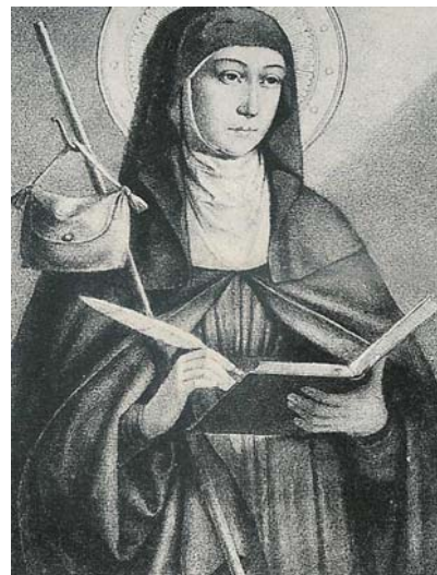
svatá Brigita Švédská, patronka Evropy