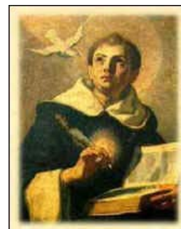
Sv. Tomáš Akvinský