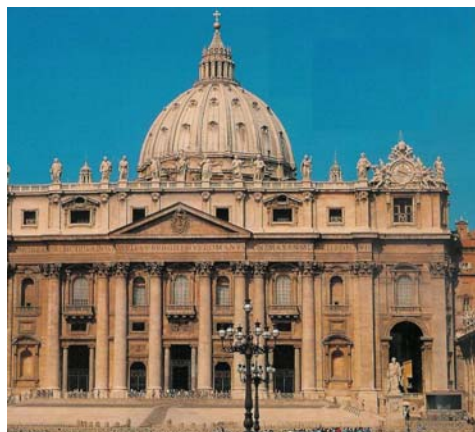
Bazilika Svatého Petra v Římě

"Který národ neměl tehdy zástupce v Římě? Který kmen nepoznal toho, čemu se Řím naučil? Do Říma soustředila neúnavná pověrčivost nejrůznější výplody marných bludů. Avšak přesto tam měly být zahanbeny pomýlené systémy filosofů, tam se měla rozplynout marná moudrost světa a měl být zdeptán kult démonů, tam čekal hrob na bezbožníka i svatokrádežníka. A do takového města se nebojíš přijít ty, svatý Petře apoštole! Spolu s Pavlem, druhem své slávy a dělníkem na díle spásy jiných četných obcí, vstupuješ sem, do onoho pralesa řvoucích šelem, do oceánu bouřlivých hlubin, a vstupuješ sem krokem pevnějším než tehdy, když jsi kráčel po vlnách mořských!"