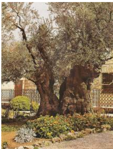
Jedna z osmi nejstarších oliv v Getsemanské zahradě na úpatí olivové hory

Proto svatý Otec píše ve své encyklice Ecclesia de Eucharistia v 3. a 4. článku: „Z velikonočního tajemství se rodí církev. Právě proto se eucharistie, jež je par excellence svátostí velikonočního tajemství, stává ohniskem života církve . Je to vidět z prvních obrazů církve, které nám předkládají Skutky apoštolů: „Setrvali v apoštolském učení, v bratrském společenství, v lámání chleba a v modlitbách“(2,42). „Lámání chleba“ odkazuje na eucharistii. Po dvou tisících letech i nadále uskutečňujeme onen prvotní obraz církve. A zatímco tak konáme při eucharistické oběti, oči duše se vracejí k velikonočnímu triduu: k tomu, co se odehrálo večer na Zelený čtvrtek během Poslední večeře a po ní. Ustanovení eucharistie totiž svátostně předjímalo události, k nimž došlo krátce nato, počínajíc smrtelnou úzkostí v Getsemanech. Znovu vidíme Ježíše, jak vychází z Večeřadla a odchází s učedníky, aby překročil potok Cedron a vstoupil do Olivové zahrady. V této zahradě je dodnes několik prastarých olivovníků. snad byly svědky toho, co se odehrálo v jejich stínu onoho večera, když Kristus v modlitbě zakoušel smrtelnou úzkost a „jeho pot stékal na zem jako krůpěje krve“ (Lk 22,44). Krev, kterou krátce předtím předal církvi jako nápoj spásy v eucharistické svátosti, začínala být prolévána; její