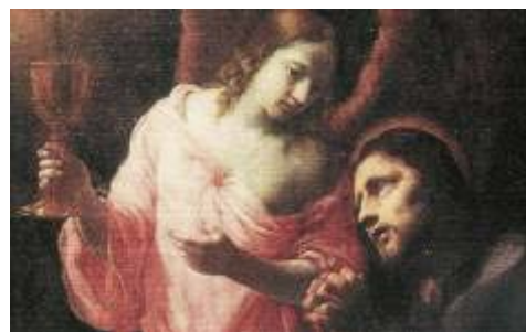
Kristus na hoře Olivetské – detail (Karel Škréta, Pašijový cyklus 1672-74)