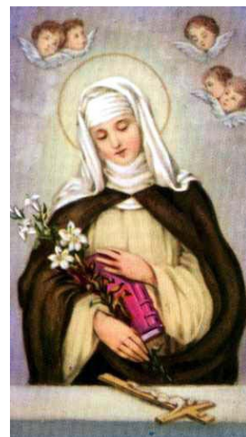
Sv. Kateřina Sienská