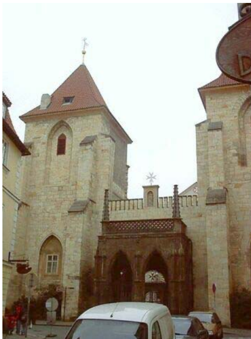
Kostel Panny Marie pod řetězem