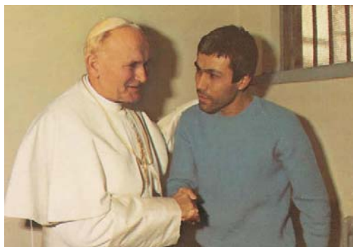
Svatý Otec Jan Pavel II. při návštěvě atentátníka ve vězení

Pak se tu objevují osoby: bíle oblečený biskup („tušili jsme, že by to mohl být Svatý otec“) další biskupové, kněží, řeholníci a řeholnice a konečně mužové a ženy všech tříd a sociálních vrstev. Zdá se jako by papež šel přede všemi, chvějící se a trpící všemi těmi hrůzami, jež ho obklopují. Nejen domy toho města jsou polorozbořené – papež kráčí mezi mrtvolami zabitých. Cesta církve je popisována jako Via Crucis , jako putování údobím násilí, ničení a pronásledování. V tomto obraze lze objevit znázorněné dějiny celého století. Jako jsou místa země shrnuta ve dvou obrazech – hora a město orientující se na kříž – tak i časy jsou