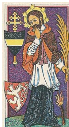
Svatý Jan Nepomucký