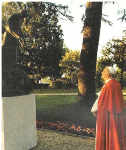
Svatý Otec Jan Pavel II. ve vatikánských zahradách 13.5.1983 po slavnostním odhalení sochy Panny Marie fatimské

mnozí z nás prožívali na začátku minulého měsíce dubna 2005 rozloučení se zesnulým papežem Janem Pavlem II jako rozloučení s blízkým přítelem, bratrem nebo vlastním otcem. Jak málo však chybělo k tomuto přechodu papeže do věčného života právě před 24 lety – 13.května 1981. Spolu se zesnulým papežem jsme přesvědčeni o souvislosti s výročním dnem fatimského zjevení Panny Marie v roce 1917. Proto papež projevil později nesmírnou vděčnost Matce Boží za záchranu, kterou mu prokázala právě v tento den největšího životního ohrožení.