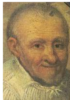
Sv. Vincenc z Pauly dobová miniatura