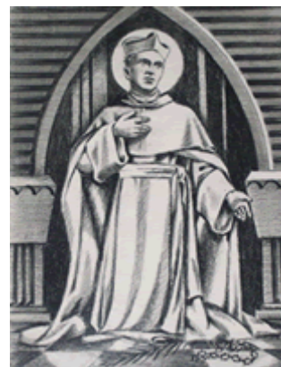
Blahoslavený Hroznata – zakladatel premonstrátských klášterů v Teplé a Chotěšově