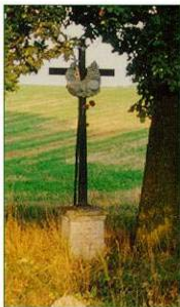
Boží muka rozesetá po české krajině dávají příležitost k zamyšlení...

U stolu pak učedníci poznali Pána při lámání chleba. Poznávejme důvěrněji Pána Ježíše také ve svatém přijímání.