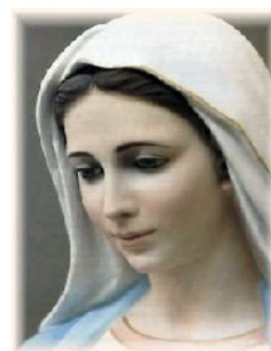
Panna Maria Lurdská