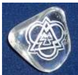
Symbol Nejsvětější Trojice

A tak zjistíme, že je lépe takový postup pomocí přirozených příměrů opustit a vidět v trojičních modelech přírody nanejvýš vzdálené symboly či náznaky onoho velkého tajemství Trojjediného Boha.