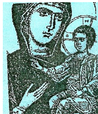
Panna Maria má raději napodobování než obdivování.