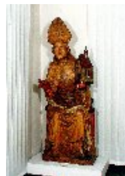
sv. Wolfgang, biskup