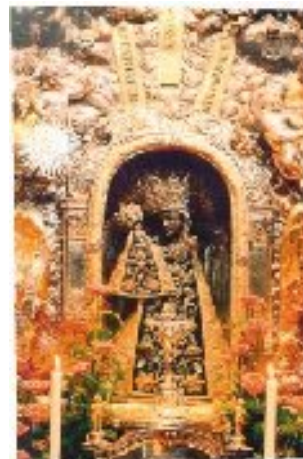
Černá madonna z Altöttingu

Vydeme-li odtud porozumíme také druhé části Ježíšovy odpovědi: Ještě nepřišla má hodina“. Ježíš nejdá nikdy pouze sám od sebe; nikdy aby se zalíbil druhým. Jedná vždy, vycházejíc od Otce, a právě to jej spojuje s Marií, protože do této jednoty vůle s Otcem chtěla i ona vložit svou prosbu. Proto po Ježíšově odpovědi, která tuto prosbu jakoby odmítá, může překvapivě a prostě říci služebníkům: „Udělejte všechno, co vám řekne!“ (J 2,5). Ježíš nedělá nějaký zázrak, nehraje si se svou mocí v záležitosti, která je v podstatě docela soukromá. Nechává vzniknout znamení, kterým ohlašuje svou hodinu, hodinu sňatku, jednoty mezi Bohem a člověkem. On jednoduše „neprodukuje“ víno, ale proměňuje lidský sňatek na obraz božského sňatku, k němuž zve Otec prostřednictvím Syna a v němž On dává plnost dobra. Svatba se tak stává obrazem Kříže, na kterém Bůh posouvá svou lásku až do krajnosti, když dává sebe sama v Synově těle a krvi – v Synovi, který ustanovil Svátost, kterou se nám po všechny časy dává. Tím je tato potřeba vyřešena opravdu božsky a původní prosba je dalekosáhle překonána. Ježíšova hodina ještě nepřišla, ale ve znamení proměnění vody ve víno, ve znamení slavnostního daru tento okamžik jeho hodinu předchází.