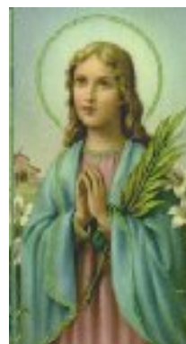
Sv. Maria Goretti