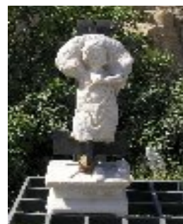
Antická socha „dobrého pastýře“ v Cesarei, Izrael

"Pojďte ke mně všichni...", říká Ježíš. Mohl by říci: To je fajn, že teď budeš mít víc času. Třeba bys mohl zaskočit častěji na návštěvu. Nejenom na bohoslužbu - před svatostánkem můžeš se mnou v tichu pobýt, a nemusíš pořád klečct, můžeš klidně posedět. Zůstaň tak chvíli v mé lásce*, úplně doslova. Mohl bys za mnou zajet na tamto poutní místo, pamatuješ, jak nám tam bylo dobře? Jestli chceš, mohli bychom spolu strávit víc času v některém klášteře, v modlitbě a v adoracích... Ale určitě se potkáme, až budeš cestovat, vždyť já jsem s tebou na všech tvých cestách, svým Duchem. Chod' se mnou. Dívej se mýma očima. Můžeš se víc soustředit na to, že žiješ se mnou. Ale jsem tichý, ztiš se, abys