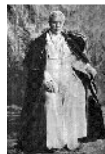
Sv. Pius X.