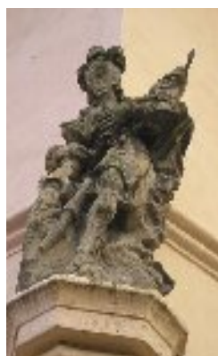
Socha sv. Floriána na nároží domu ve Mšeně u Mělníka

V opakování Desatera v Páté Mojžíšově se připomíná u slavení dne odpočinku, aby člověk pamatoval, že Hospodin ho vysvobodil z egyptského otroctví, z roboty. Kolikrát si naříkáme, že dřeme jako otroci, takže ani nemůžeme jít někdy sváteční bohoslužbu ve všední den, a někteří dnes v rozšířeném kultu práce musejí se podrobit pracovní povinnosti i v neděli nebo o zasvěcených svátcích. Jaký to pokrok a vymoženost moderní doby! Občas je však potřeba vyjít z "Egypta" všedního pracovního kolotoče, abychom se mohli věnovat svým nejbližším, být s nimi a být i s Bohem, jak nám to dobře radí dvojice největších přikázání o lásce k Bohu a k bližnímu na nichž "stojí Zákon i proroci" (viz Dt 6,5; 10,12nn; Mt 22,34-40). Nechme se vyvést z přemíry starostí, spočinout, odpočinout, radovat se z dober stvoření, křepčit a jásat, věnovat se spolu s Bohem sobě, abychom mohli, jsouce občerstveni, občerstvovat pak druhé. Dodržovat sedmý den jako den odpočinku bylo jedno z nejpřísnějších Hospodinových přikázání, jehož porušení se trestalo smrtí (Ex 31, 12-17). Má to svoji logiku. Odpočinek totiž chrání sílu, dar života. Copak nevíme, jak dopadají lidé, kteří se přes míru vysilují prací a starostmi? A jakou má takové mučednictví