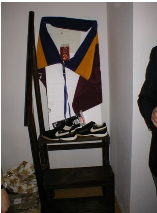
Dárek nejmilejší – kopačky a spartánské barvy (osuška)