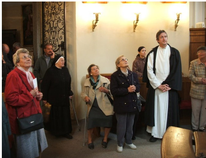
Unikátní umístění svatostánku na závěsných řetězech vzbuzuje údiv všech poutníků

Při kostelu stojí bývalý lovecký zámek rodu Buquoyů, zámek později sloužil jako fara, škola pro okolní obce a konečně dnes funguje jako klášter kongregace Šedých sester III. řádu sv. Františka. Do Lomce směřují dodnes cesty mnohých věřících. Hlavní pouť se koná vždy 12. září (nejbližší neděli), kdy se slaví svátek Jména Panny Marie. Pout' se zde koná navíc každou první sobotu v měsíci a 13. den v měsíci připadá na tzv. Fatimský den.