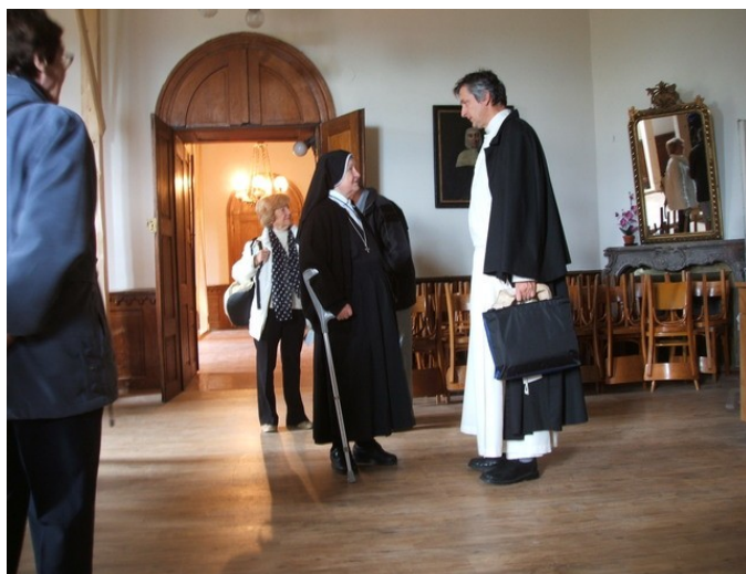
Interiér kláštera (zámku) ve Štěkně

Při kostelu stojí bývalý lovecký zámek rodu Buquoyů, zámek později sloužil jako fara, škola pro okolní obce a konečně dnes funguje jako klášter kongregace Šedých sester III. řádu sv. Františka. Do Lomce směřují dodnes cesty mnohých věřících. Hlavní pouť se koná vždy 12. září (nejbližší neděli), kdy se slaví svátek Jména Panny Marie. Pout' se zde koná navíc každou první sobotu v měsíci a 13. den v měsíci připadá na tzv. Fatimský den.