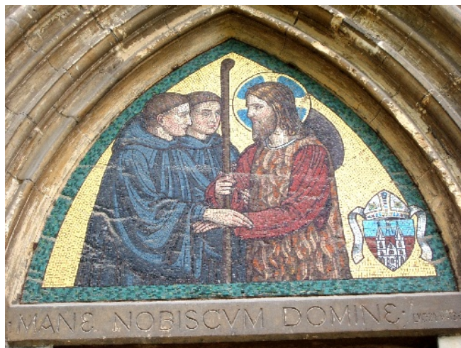
Obraz s nápisem: „MANE NOBISCUM DOMINE“ Pane, zůstaň s námi