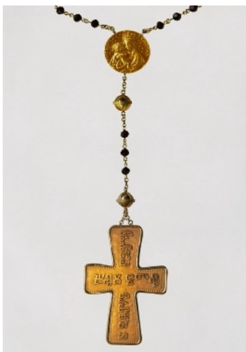
Tento růženec darují čeští biskupové papeži

Poslední růžencové tajemství světa nás podněcuje, abychom v blízkosti Bohorodičky rozjímali o daru eucharistie. Je také jedním z mnoha užitečných způsobů, jak se připravovat na slavení mše svaté. Zamysleme se proto i v tomto kněžském roce nad některými skutečnostmi, které jsou v tomto slavení přítomny.