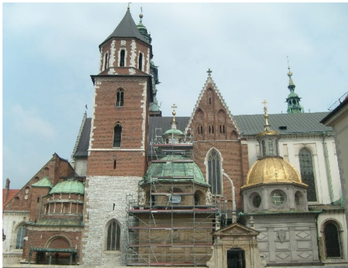
Krakov - Wawel