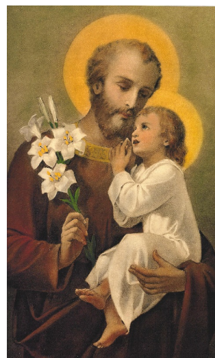
Svatý Josef s Ježíškem