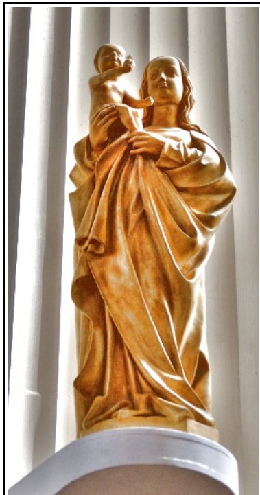
Socha Panny Marie z kostela sv. Jana Nepomuckého v Košířích

Vidět jako Maria, myslet jako Maria, věřit jako Maria, milovat jako Maria a žít jako Maria! To je touha každého dítěte Nebeské Matky a Bohorodičky Panny Marie. Jde o určitou podobnost, která je založena na společných rysech duchovního života, který je křesťanský, protože Maria vidí, myslí, miluje a žije podle Krista. Ten, kdo se řídí Kristem je skutečným křesťanem. Potvrzuje to sám Pán slovy: „ Má matka a moji bratři jsou ti, kdo slyší Boží slovo a podle něho jednají “ (Lk 8,21). On sám je vtěleným Božím Slovem, které přišlo na svět. Jemu je třeba ve víře naslouchat a podle něho jednat. To, co zde Ježíš říká, ukazuje, jakou roli hraje víra v novém řádu věcí, které ustanovil svým příchodem na svět. Pro Ježíše a pro čtenáře Lukášova evangelia (srv. 1,38) se tato slova vztahují především na Marii, nejlepší příklad víry. „ Mariina víra během celého jejího života až do poslední zkoušky, kdy Ježíš, její Syn, zemřel na kříži, nikdy nezakolísala. Maria nepřestávala věřit, že „se splní“ Boží slovo. Proto církev v Marii uctívá nejčistší uskutečnění víry “ (KKC 149).