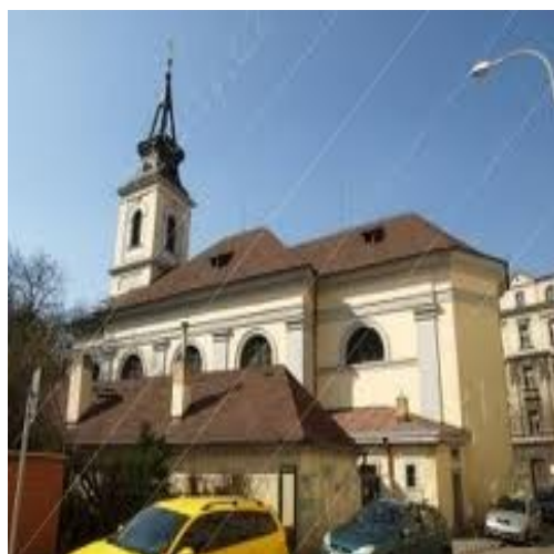
kostel Nejsv. Trojice na Smíchově - Košířská farnost

V polovině měsíce června letos slavíme poutní slavnost našeho farního kostela Nejsvětější Trojice. Jde o titul kostela skutečně na výsost vznešený a podstatně křesťanský, zachycující samotného Boha ve třech osobách. Proto si zaslouží stálou a největší pozornost, vždyť do Jeho života jsme byli koupelí křtu ponořeni. „V něm žijeme, pohybujeme se, jsme...“, jak to připomíná řeckým učencům apoštol Pavel v Aténách. (Sk 17,28)