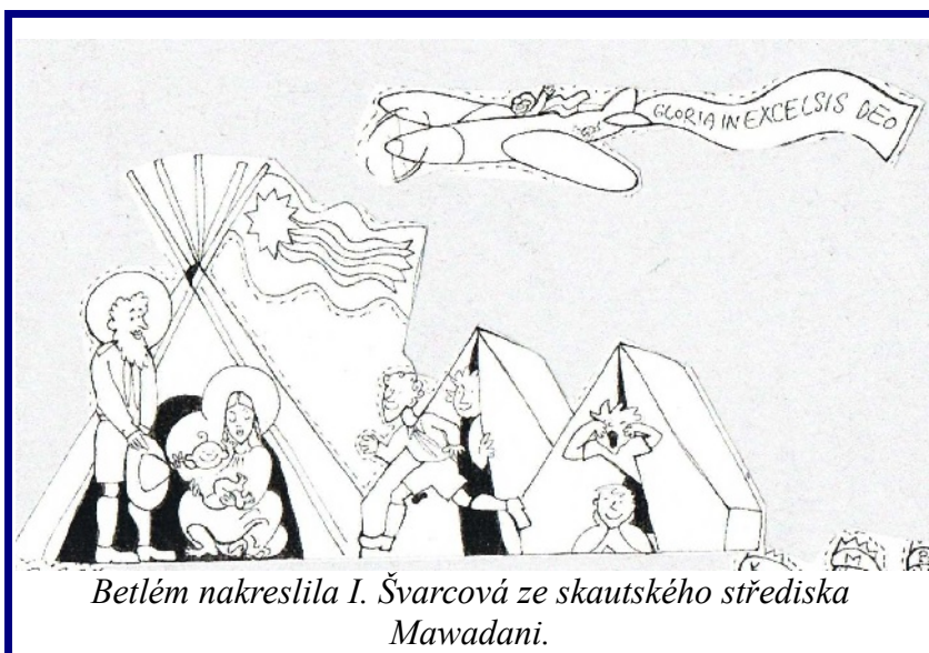
Betlém nakreslila I. Švarcová ze skautského střediska Mawadani.

Existují skutky, jejichž volba je vždy špatná vzhledem k předmětu (například rouhání, vražda, cizoložství). Jejich volba v sobě zahrnuje zvrácenost vůle, to je mravní zlo, jež nelze ospravedlňovat případnými dobry, která by z něho mohla vzejít.