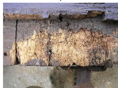
původní stav dveří u Nejsv. Trojice

Přestože jednotlivé částky nejsou v řádech statisíců, celek spolehlivě vyčerpá rezervy farnosti. Z toho důvodu bude v říjnu uspořádána mimořádná sbírka.