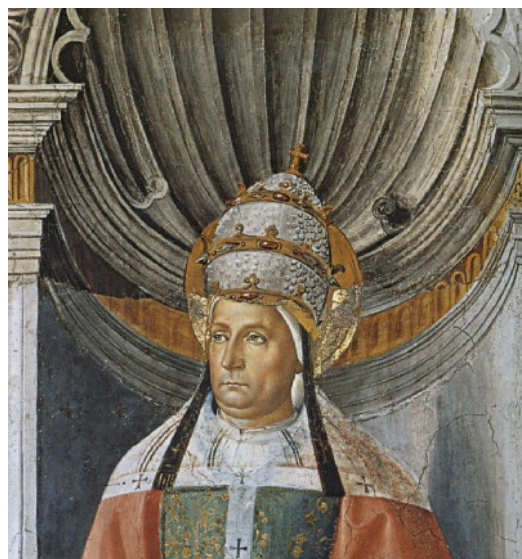
Freska v Sixtinské kapli (výřez)

Během jeho čtrnáctiletého působení byl v pronásledování křesťanů poměrný klid. O jeho pontifikátu není mnoho známo. Rozdělil Řím na sedm obvodů, v čele každého stál jáhen diakon. Ustanovil také sedm podjáhňů. Dále ustanovil notáře – úředníky, aby shromáždili Akta mučedníků, tj. zprávy o soudním