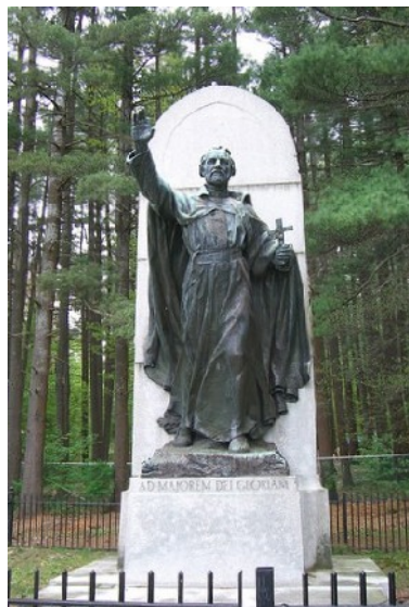
Památník P. Izáka Joguese na místě mučednické smrti