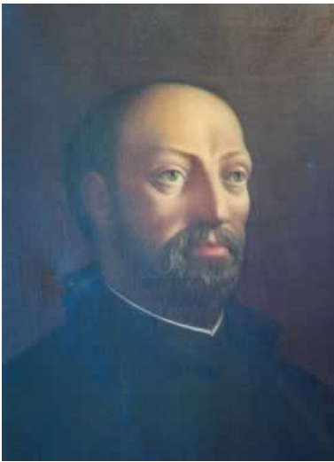
P. Jean Brébeuf knihovna v Torontu

Dne 19. října si připomínáme skupinu osmi francouzských jezuitských misionářů, kteří v polovině 17. století působili mezi indiánskými kmeny Hurónů a Irokézů a podstoupili tam mučednickou smrt. Většina z nich pracovala a zemřela na území dnešní Kanady, tři na území dnešních USA.