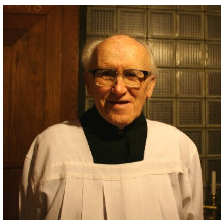
V kostele sv. Jana Nepomuckého

My ho známe především jako věrného farníka, který pokorně, v již pokročilém věku, přísluhoval jako ministrant zejména při sobotních bohoslužbách v kostele sv. Jana Nep. V historii naší Košířské farnosti zůstává také na jednom z vysokých vrcholů i pro svou šlechetnou dobročinnost, s níž přispíval k vybavení a kráse našeho chrámu (jeden z příkladů je večerní osvětlení kostela sv. Jana Nep.).