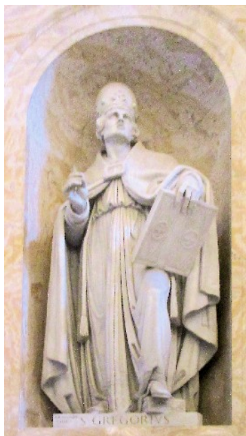
Socha v chrámu sv. Pavla před hradbami

O původu a mládí Hildebranda víme málo. Narodil se v rozmezí let 1020 až 1025 pravděpodobně v Saoně v italském Toskánsku. Základní vzdělání dostal v Římě v kláštře na Aventinu a v Lateránu. Po synodě v Sutri (r. 1046) provázel sesazeného papeže Řehoře VI. do exilu v Kolíně nad Rýnem jako jeho kaplan. Po jeho smrti odešel do kláštera v Cluny a zažil tam dva vynikající opaty Odila a Huga. Tam se také stal benediktinem. (Není vyloučeno, že do řádu vstoupil už v Římě.)